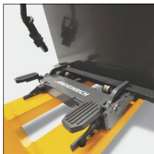
Gestión profesional de la batería